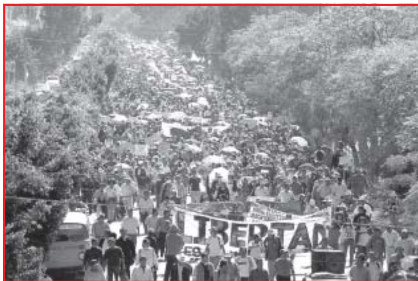
O poder dos trabalhadores e do povo da Comuna de Oaxaca se sustenta sobre a Assembleia Popular dos Povos de Oaxaca (APPO), que reúne cerca de 365 organizações operárias e populares e define cada passo da luta

Na ocasião, Ulises ficou paralisado. A população, por sua vez, organizou a APPO (Assembleia Popular dos Povos de Oaxaca) que se transformou, de fato, em um poder paralelo e levantou a bandeira do "fora Ulises". Desde então, o governador organizou uma série de provocações com bandos que resultaram numa intervenção armada