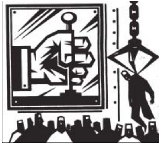
Samuel Gosa / Caros Amigos

São vários os critérios que serão utilizados pela Secretaria de Educação (SED) para avaliar o desempenho dos trabalhadores em educação. Entre eles, a capacidade de iniciativa, a disciplina, a produtividade e até o empreendedorismo. O objetivo é pressionar os trabalhadores para melhorar o ritmo de trabalho e a capacidade de administrar o tempo para garantir altos níveis de desenvolvimento das instituições de ensino. A finalidade da inclusão destes e de outros critérios é a obtenção de resultados satisfatórios em relação às atribuições e metas estabelecidas pelo sistema de ensino. Conforme documentos das agências internacionais, citados no texto da professora Olinda Evangelista, na última edição do Jornal do SINTE , as atribuições e metas dos sistemas de ensino vêm sendo redefinidas na perspectiva da educação estar cada vez mais "em consonância com o mercado". Não é por acaso que a descentralização transformou-se em palavra de ordem, pois tal combinação implica na necessidade de se adequar as peculiaridades do mercado local, sem perder de vista as questões globais.