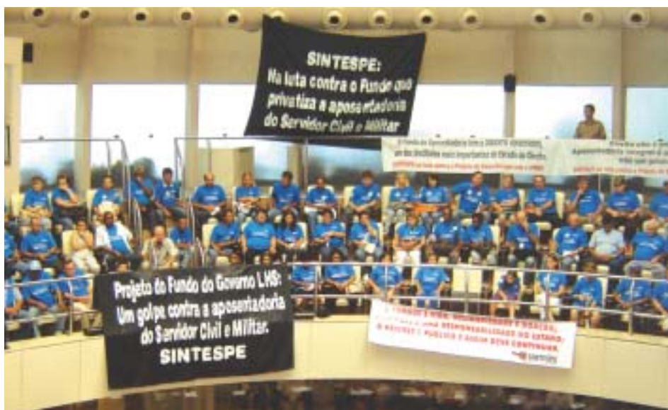
Servidores participam de protesto contra mudanças no Iprev

O Governo LHS (PMDB/PSDB/DEM) teve a resposta: Não ao IPREV! Se as audiências públicas promo-