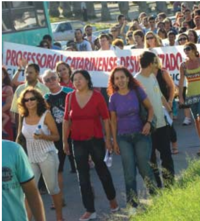
Trabalhadores em Educação fazem passeata nas ruas de Fpolis

O SINTE/SC ressalta a importância de que mesmo diante de toda a repressão seguiram a deliberação da Assembléia Estadual. Talvez, se tivéssemos construído um calendário de lutas, mesmo a partir do dia 5 de março, a categoria pudesse responder massivamente. A direção do SINTE/SC esclareceu o conteúdo regressivo do