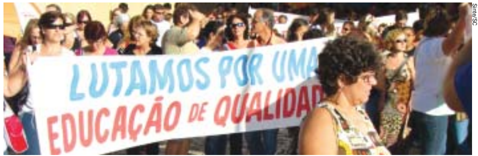
Professores preocupados com a Educação